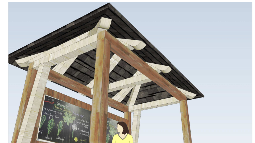
pohľad na konštrukciu strechy

projekt pre územné rozhodnutie - architektonicko-urbanistická štúdia