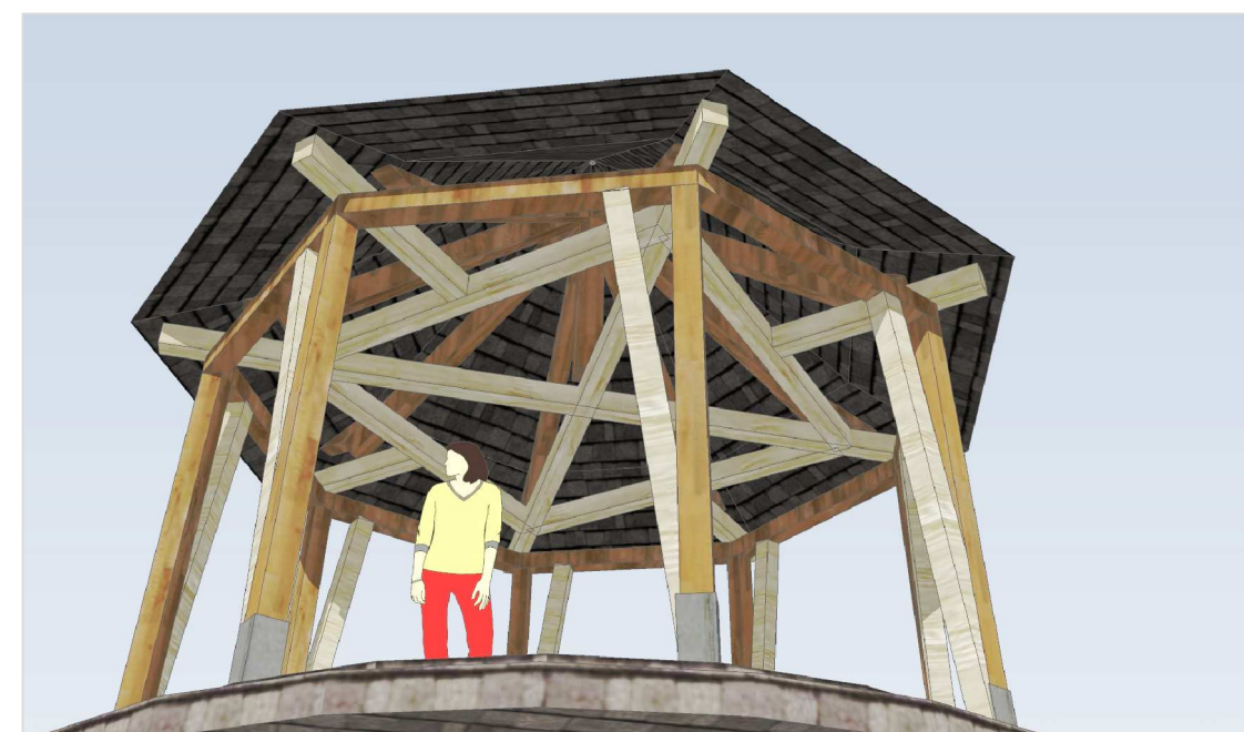
pohľad do krovu